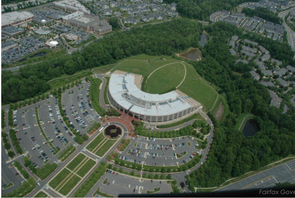
Fairfax Government Center