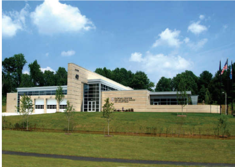
Fire Station 40

حسنًا، وكيف سنحدها؟ ضع قائمة تضم التهديدات والمخاطر التي يتعرض لها المجتمع وحدد الأصول التي سيحتاج إليها الحي الذي تقطن فيه لمواجهة كارثة ما. حدد ما إذا كان الأصل عرضةً للتلف وما الإجراء الذي يمكن القيام به للحد من قابليته للتلف. تأكد من تسجيل الموقع ومعلومات الاتصال إذا أمكن. فيما يلي مثال لجدول يمكنك استخدامه: