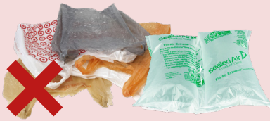
塑料袋、薄膜和枕头包装