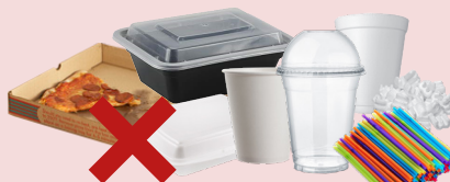
泡沫和塑料外卖杯及容器