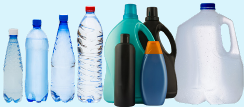
塑料瓶和罐子（盖上）