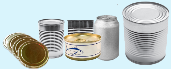
金属食品和饮料罐